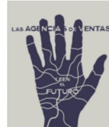
Las agencias de ventas leen el futuro - Ventana Sur 2025