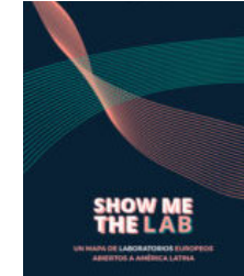
Show me the Lab - Un mapa de laboratorios europeos abiertos a América Latina