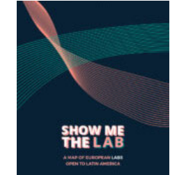
Show me the Lab - A Map of European Labs Open to Latin America

Acerca de LatAm cinema / Publicidad / Revistas digitales / Videos / Entrevistas y especiales / Contacto / Suscríbese