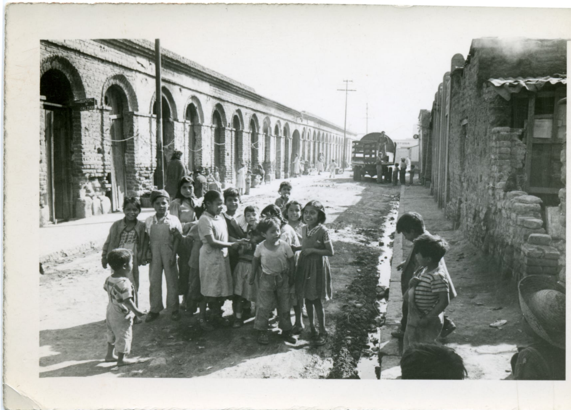
Foto tomada por Buñuel localizando exteriores en Nonoalco , CDMX.