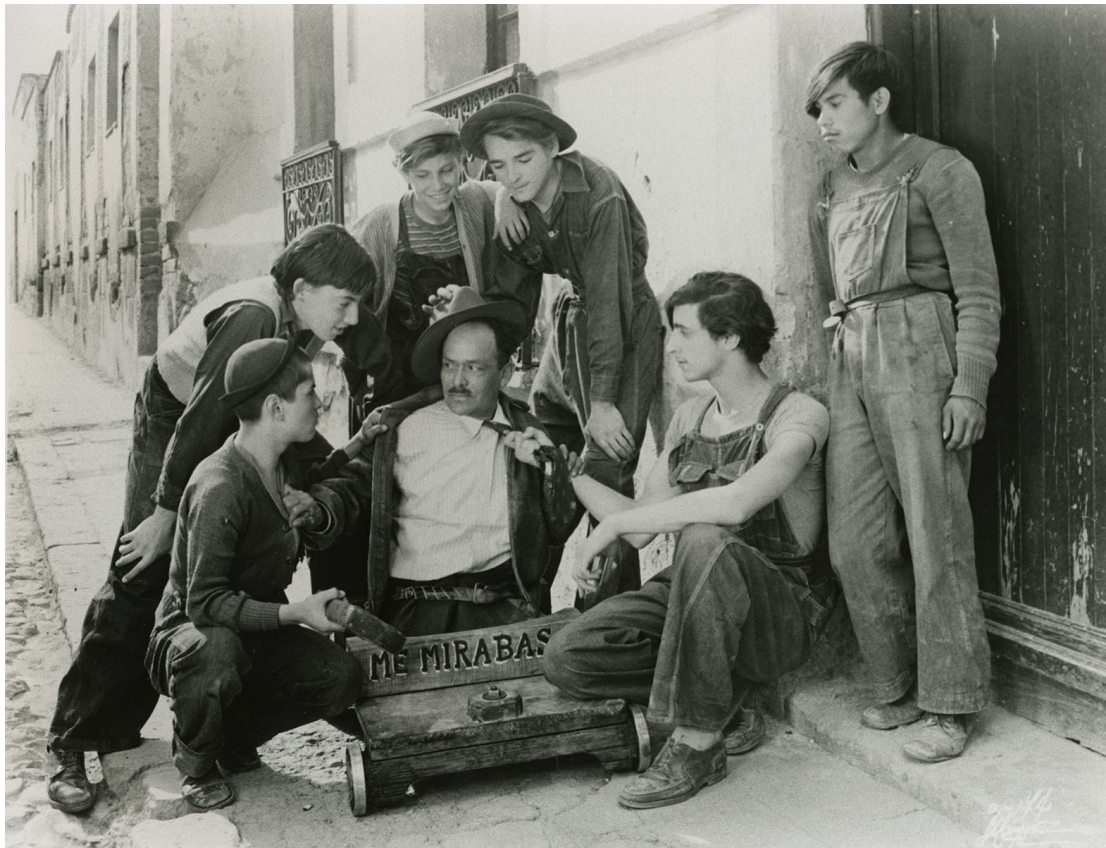
Robo al hombre sin piernas.