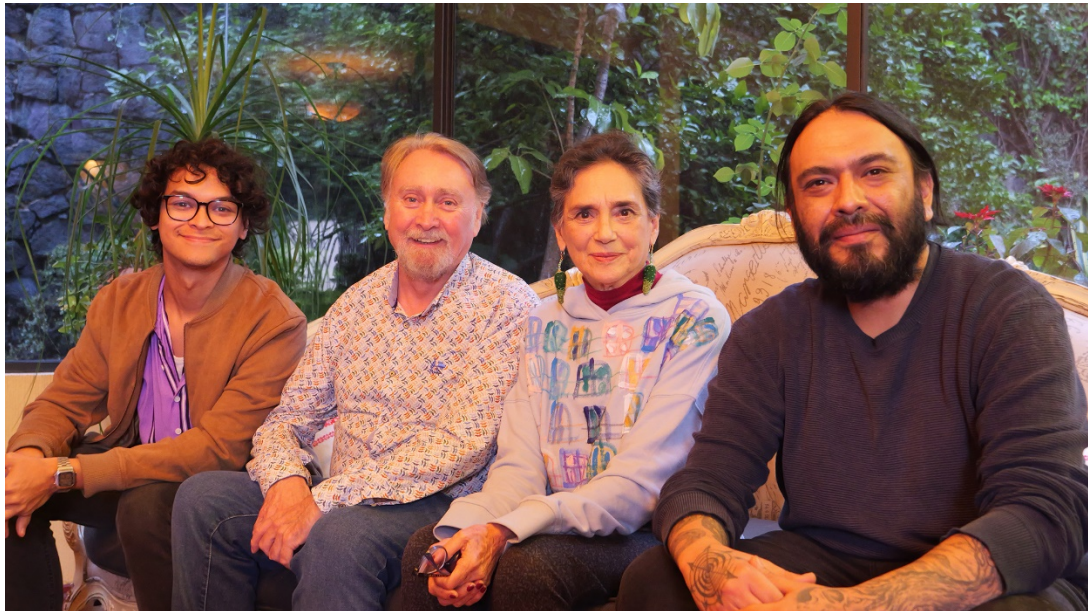
Foto tras la entrevista con Ofelia Medina en CDMX.