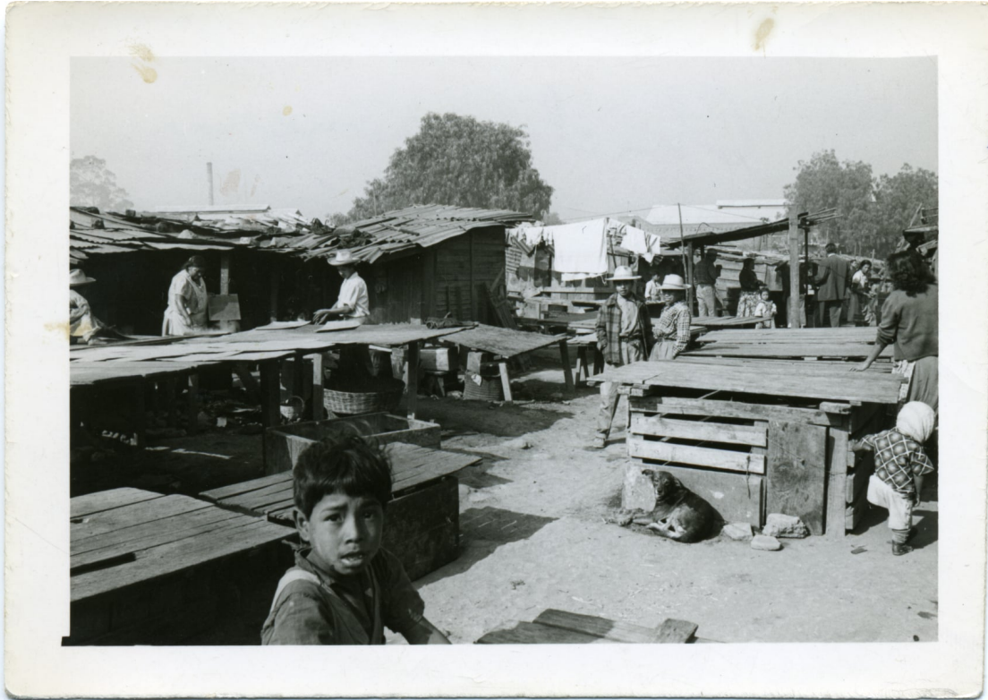
Foto tomada por Buñuel localizando exteriores en la "chicharronería", CDMX.